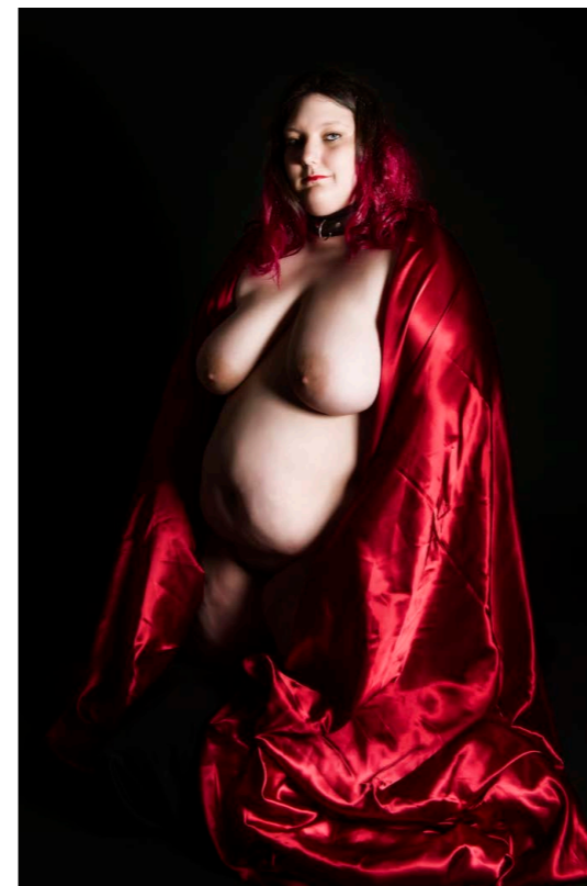
Master Awaits Me

"Der er jeg nok lidt old fashioned – jeg lægger lys på ved hjælp af flashlamper. Og så instruerer jeg modellen, hun kom-